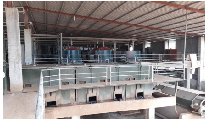
CTCP Nông sản Ngọc Lặc Xanh