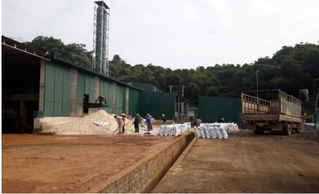
CTCP Nông sản Ngọc Lặc Xanh

Năm 2018-2019, Công ty Cổ phần Chế biến Nông sản Hồng Hà Sơn La đã ra nghị quyết về việc đầu tư vốn vào Công ty TNHH MTV Cường Sinh Yên Châu - là một trong các công ty cung cấp nguyên liệu đầu vào cho Công ty CP Chăn Nuôi CP Việt Nam và đầu tư thành lập CTCP HongHa Pharma với số tiền 20 tỷ đồng (chiếm 40% vốn chủ sở hữu).