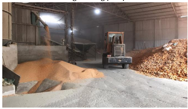
Công ty TNHH MTV Cường Sinh Yên Châu