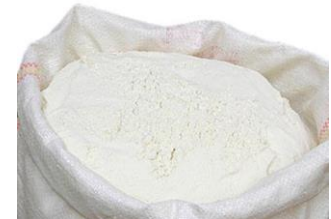
Tinh bột sắn

Song song với việc này, Công ty cũng sử dụng các công nghệ, dây chuyền sản xuất hiện đại, Ban Tổng Giám đốc và đội ngũ cán bộ nhân viên của Công ty luôn chú trọng công tác nghiên cứu, cải tiến quy trình lao động mới trong quá trình phát triển. Cụ thể, Công ty thường xuyên cập nhật và tổ chức các buổi làm việc, tham quan trao đổi kiến thức, tập huấn làm chủ máy móc trang thiết bị với các cơ quan, viện nghiên cứu khoa học trong nước. Mặc dù có nguồn nguyên vật liệu đầu vào dồi dào tuy nhiên cải tiến quy trình để giảm thiểu hao phí nguyên vật liệu, hạn chế phát thải có ý nghĩa rất lớn đối với môi trường địa phương, tiết kiệm nguồn nguyên liệu đầu vào giúp giảm giá thành cho sản phẩm. Những nỗ lực không ngừng của HSL về cải tiến công nghệ, nâng cao hiệu quả sản xuất và gắn liền trách nhiệm xã hội trong từng hoạt động sản xuất kinh doanh giúp tiết kiệm tài nguyên thiên nhiên và góp phần giải quyết các vấn đề môi trường.