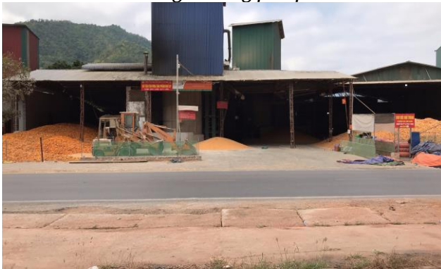
Công ty TNHH MTV Cường Sinh Yên Châu